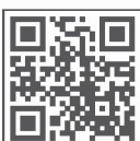
Tabella di riferimento

Via Arcora Provinciale, 60 - Palazzo GE.COS. Casalnuovo di Napoli - 80013 (NA) e-mail: info@corradowelizia.com Pec: info@pec.corradowelizia.com www.corradowelizia.com