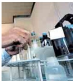
Gli impianti In pagina, foto degli impianti di Acqua Campania; sopra, un ricercatore effettua controlli di laboratorio sulla qualità dell'acqua.