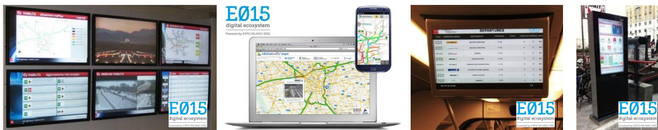
Immagini di alcune applicazioni E015 già disponibili realizzate dalle aziende che hanno partecipato alla prima fase di sperimentazione in ambito trasporti e infomobilità